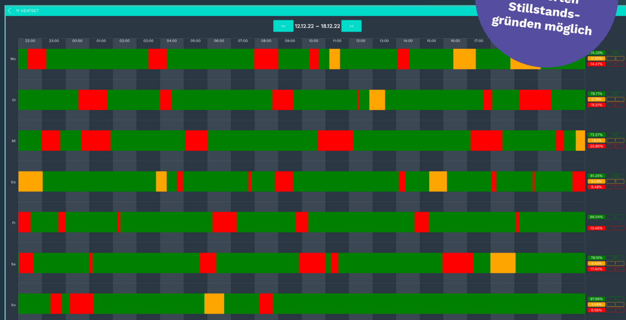
Beispieldarstellung einer Fräsmaschine mit Stillstands- und Produktivzeiten inkl. Stückzählung

Rückmeldung zu individuell definierten Stillstandsgründen möglich